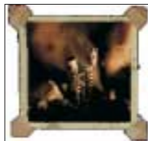
PEARL JAM "RIOT ACT"

Durante el mes de enero se podrán escuchar algunas de las mejores actuaciones del Minifestival de Música Independiente 2002, bandas como Orlando, Sing Sing, Vacaciones o Relics, mientras que el programa grabará íntegramente el Minifestival de Música Independiente 2003 a celebrarse el próximo mes de febrero en Les Basses de Barcelona.