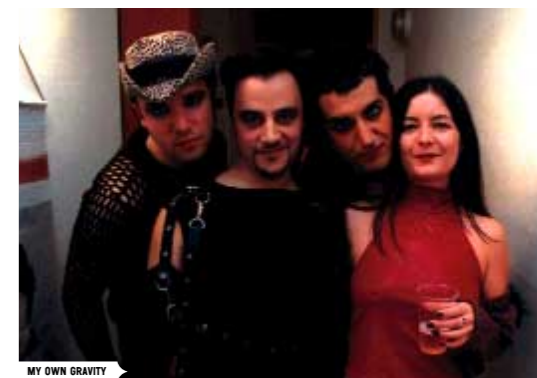
MY OWN GRAVITY